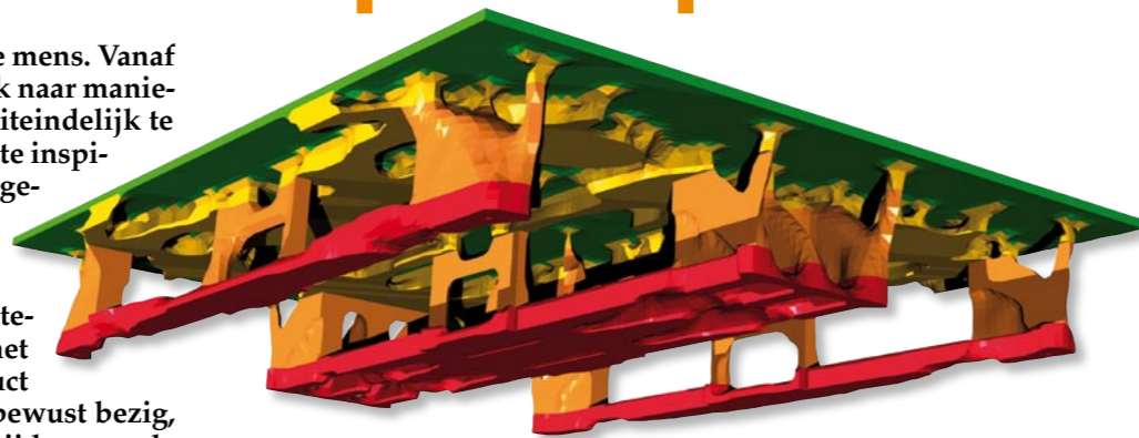
Automatisch gegenereerde geometrie van een kunststof pallet. De voor Computer Aided Optimization kenmerkende organische vormen zijn hier mooi terug te zien.

kelijk van het moment dat de software in het productontwikkelingsproces wordt ingezet. Naarmate het proces vordert wordt de ontwerpruimte ingeperkt. Het laatste maar zeker niet onbelangrijkste component van een optimalisatieprobleem wordt gevormd door de randvoorwaarden en door de belastingen.